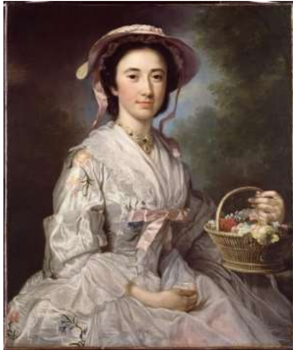
Imagen 20. Neckerchief.

La modesta tenía una función similar concerniente a la parte baja del escote. El pañuelo, a veces llamado Neckerchief, era un gran cuadrado de lino, muselina o seda, doblado y enrollado alrededor del cuello, este era empleado en ocasiones formales, por otro lado, existían un pañuelo conocido como half – handkerchief el cual se usaba en ocasiones informales.