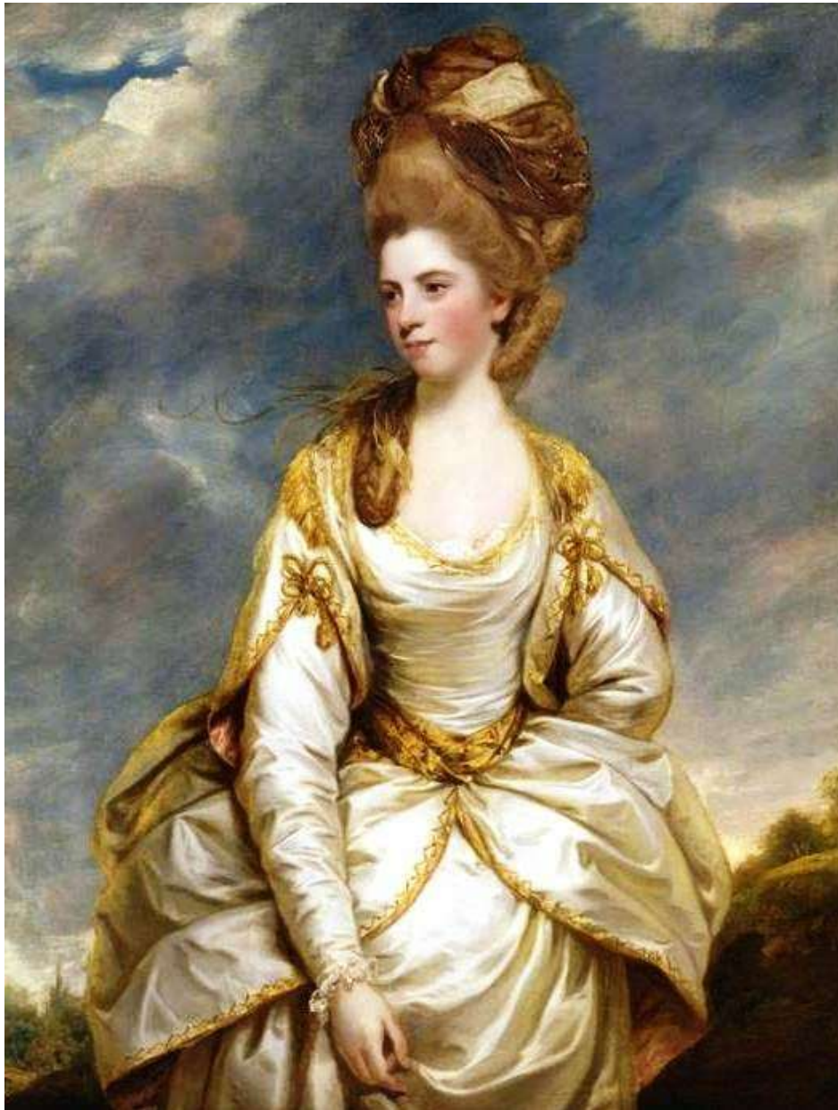
Imagen 22. Vestido con polisón.

Algunas mujeres comenzaron a usar chalecos masculinos e incluso vestir con un sobretodo o una chaqueta de montar la cual tenía solapas y un cuello triple en cascada.