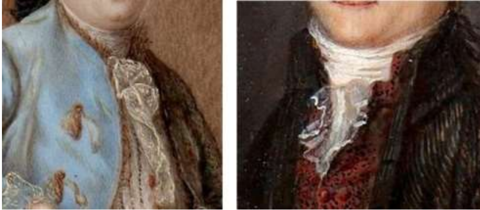
Imagen 13. Corbata siglo XVIII.

“A principios de siglo se usó una gran corbata que consistía en un trozo de tela fina, generalmente terminada en encajes, la cual era anudada flojamente sobre el cuello. Pronto entró en desuso y fue sustituida por el corbatín, una tira de tela fina plegada horizontalmente que se ponía tapando el cuello de la camisa y se abrochaba por detrás con una hebilla” 1 .