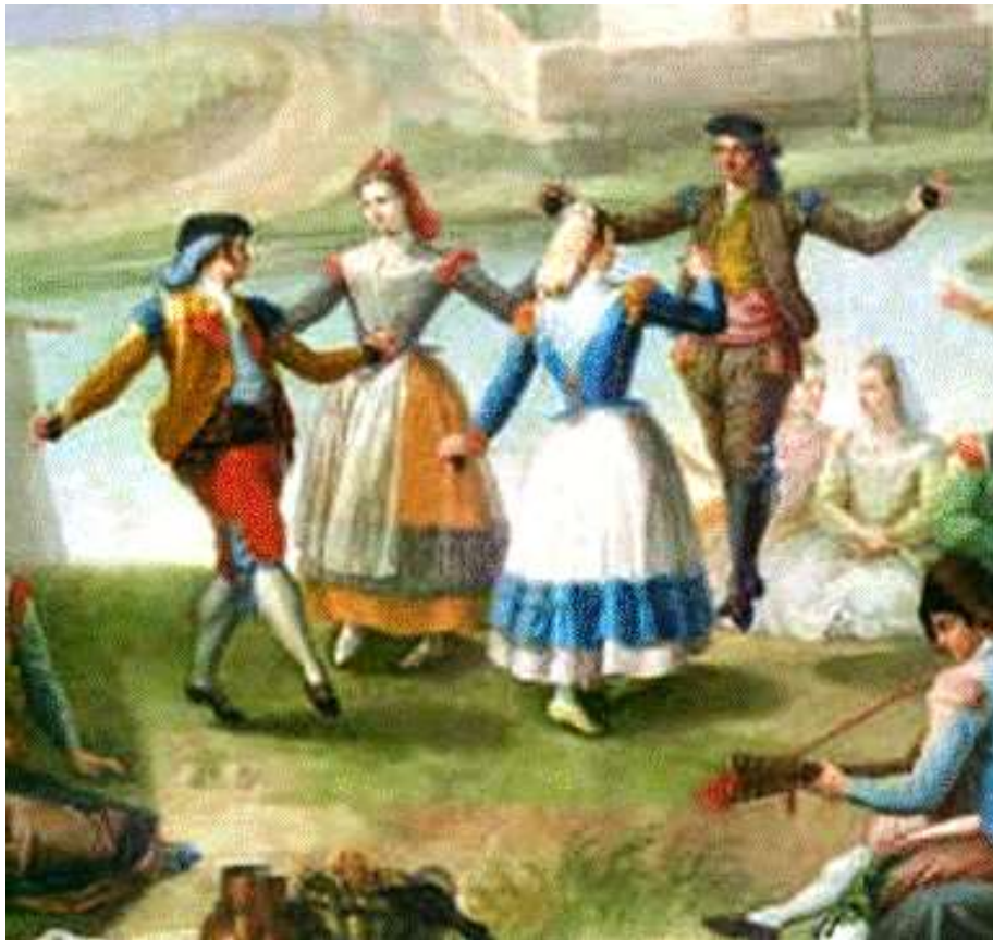
Imagen 36. Majos.

Las mujeres de estas clases solían llevar el cabello recogido en una cofia llamada a menudo escofia. “Adornaban su jubón o casaca como las prendas masculinas, pero se diferenciaban de aquéllas en las haldetas (piezas que cuelgan desde la cintura hasta un poco más abajo), el escote era cubierto con un pañuelo blanco. Las piernas eran cubiertas con una basquiña llamada guardapiés y un delantal decorativo” 8 .