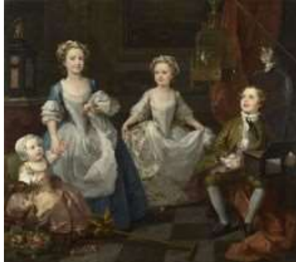
Imagen 4. Los hermanos Graham, de William Hogarth, 1742.

En 1740 los jóvenes comenzaron a usar un stock que consistía en una pieza de lino o batista a veces endurecida con un cartón y abrochada por detrás. A menudo se llevaban con una corbata negra conocida como solitario. Esta era usada generalmente con una peluca bag.