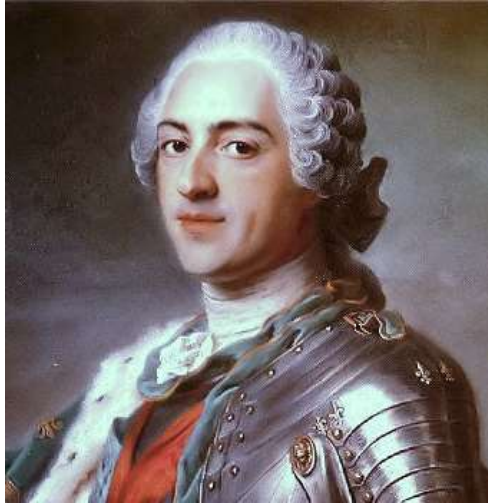
Imagen 11. Peluca con bucle.

Cuando la ocasión requería etiqueta, los hombres llevaban una peluca corta acabada en un bucle que cubría la parte posterior del cuello. Los clérigos y estudiantes ostentaban una peluca corta de rizo más pequeño.