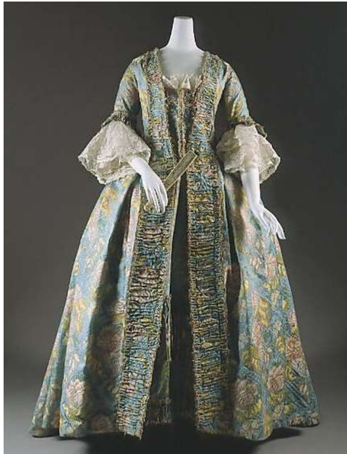
Imagen19. Vestido abierto.

Las mangas características del siglo XVIII acababan encima o justo por debajo del codo, y eran lo suficientemente anchas como para permitir que la manga de la camisa saliese por debajo con sus volantes de encaje. Algunas veces los volantes eran dobles o triples, los superiores ligeramente más cortos para que se pudiera ver mejor el encaje de los inferiores. Estaba de moda llevar a juego el encaje de las mangas, el de la cofia y el del Tucker. El Tucker era el bordado blanco que remataba el cuerpo, originalmente parte de la ropa interior, aunque se cosía por separado muy a menudo.