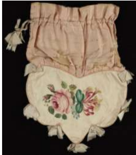
Imagen 26. Reticule o ridículo.

Finalmente, al ser los vestidos tan transparentes y de extrema fragilidad dejaron de servir los bolsillos, gracias a ello, apareció un pequeño bolso de mano conocido como reticule o ridículo que las mujeres empezaron a llevar consigo dondequiera que fueran.