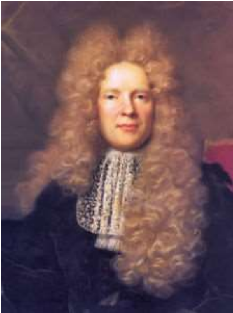
Imagen 8. Peluca in-folio.

Dentro de estos accesorios se podía encontrar una peluca conocida como in-folio la cual era muy ostentosa y cara. Consistía en una masa de rizos que enmarcaban la cara y caían por debajo de los hombros. Los hombres elegantes la llevaban incluso más larga y hasta 1710 aproximadamente tenía un gran desarrollo de altura. En las casas eran reemplazadas por un gorro bordado por lo cual algunos literarios y filósofos aparece en retratos con la cabeza destapada y el cabello corto.