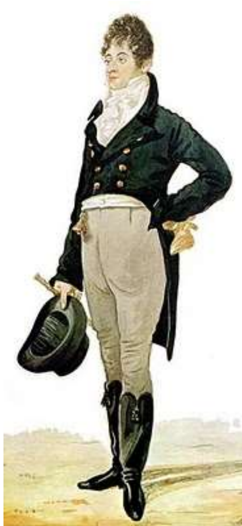
Imagen 7. Traje inglés de campo.

La chaqueta de caza tenía ahora unas colas extravagantemente largas, los zapatos de reemplazaron por unas botas de enorme tamaño, los chalecos se hicieron más cortos, los cuellos adquirieron una gran altura por detrás de la cabeza y los pañuelos se volvieron tan voluminosos que, a veces, subían por encima de la barbilla e incluso tapaban la boca. Las pelucas dejaron