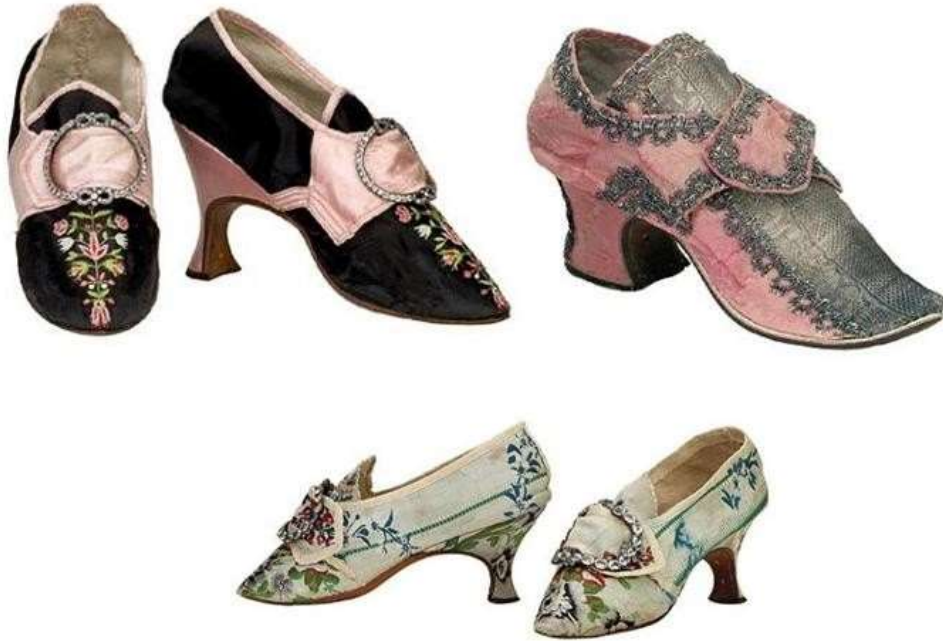
Imagen 33. Zapatos.

“Se caracterizan por su elevado tacón, situados en la curvatura del pie para dar una mayor estabilidad. Durante este siglo no había diferencia en la horma entre el pie derecho y el pie izquierdo. Además del vestido, se dedicó especial atención entre las clases altas de la sociedad a los complementos y adornos” 5 .