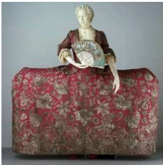
Imagen 17. Vestido volante con miriñaque.

Durante este periodo se reincorpora el miriñaque. En vez de la altura, las mujeres parecen preferir la anchura y la falda se extiende hacia los lados, a veces hasta 15 pies mediante el uso de ballenas o de varillas de mimbre. La extraordinaria anchura de las faldas femeninas en este periodo provocó algunos inconvenientes: resultaba imposible que dos damas pasaran a la vez por una puerta o que se sentasen juntas en el mismo carruaje.