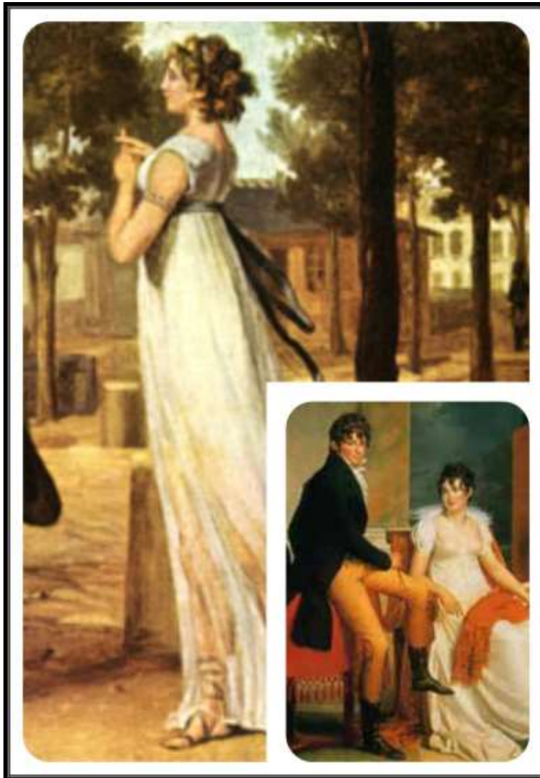
Imagen 32. Peinados.

Durante este periodo, los peinados se simplificaron con la intención de imitar las estatuas clásicas, pero el efecto se estropeaba, en cierto modo, con los adornos de plumas de avestruz que solían colocarse en el cabello. Estos tocados eran llevados durante el día y no existía la diferencia entre un vestido de tarde y un vestido de mañana.