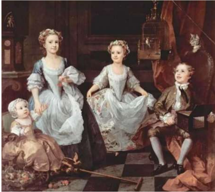
Imagen 35. Los niños de Graham. William Hogarth. 1742.

Los trajes no tuvieron muchos cambios con respecto al siglo anterior, en este, los niños siguen vistiéndose como sus padres, la única diferencia que existía era que los niños varones ya no vestían con falda, como las niñas, sino con pantalón.