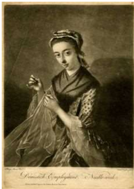
Imagen 21. Half – handkerchief.