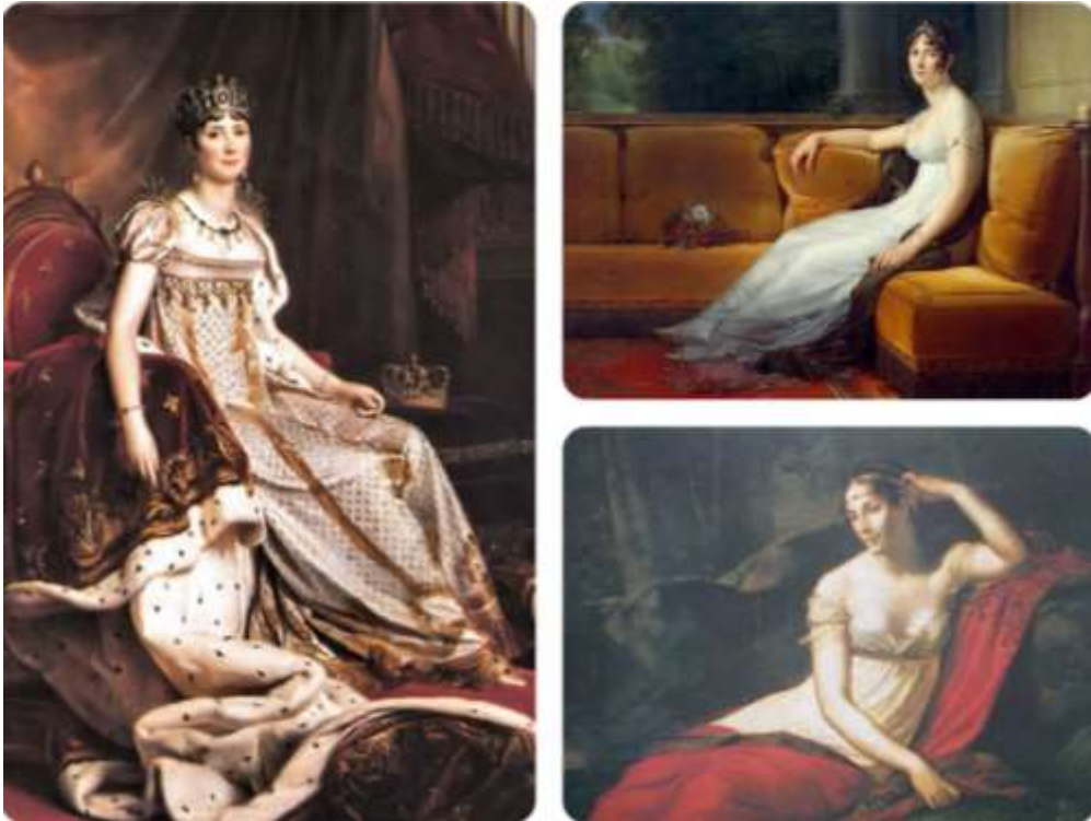
Imagen 25. Vestido camisa.

Los vestidos femeninos fueron menos extravagantes, pero presentaban un corte incluso más drástico que los pasados. Se prescindió del miriñaque, del corsé, así como de los ricos tejidos con lo que se hacían estos vestidos. En vez de esto, las mujeres llevaban un vestido camisa el cual parecía más ropa interior ya que era una prenda de cintura alta, de muselina, lino o calicó (tejido de algodón) que caía hasta los pies y a veces tan transparente que era necesario llevar forros blancos o rosas debajo. En cuanto a los zapatos, usaban sandalias sin tacón.