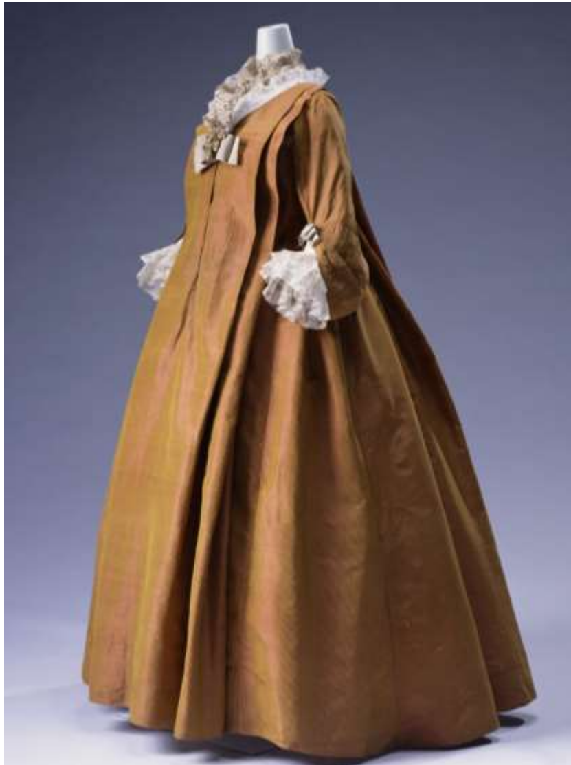
Imagen 16. Vestido volante.

Tras la muerte de Luis XIV el vestido cambio convirtiéndose en un vestido “saco”: una vestimenta cómoda y sin forma definida, con pequeños grupos de pliegues detrás en la espalda. Cuando estos pliegues eran dobles o triples y caían desde el cuello, uniéndose por debajo de los hombros con los pliegues del vestido, se llamaban Sackback, o más comúnmente pliegue Watteau (pintor francés), conocido así debido a que en todas sus obras pintaba este tipo de pliegue. Una variante de este vestido, era el vestido volante o vestido flotantes.