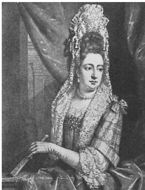
Imagen 27. Fontange.

Durante este siglo surgieron nuevos peinados con el cabello sobresaliendo en altura y coronado debido a una cofia logrando así que aumentara su altura, acentuando el efecto de verticalidad. Las mujeres, en general, no llevaban peluca pero se empolvaban el cabello al que añadían, a veces, rizos postizos que se llevaban en la parte posterior de la cabeza.