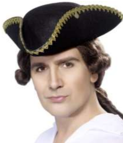
Imagen 5. Sombrero de 3 picos.

El sombrero de 3 picos o tricornio fue de uso común a lo largo de todo el siglo, aunque la gente del campo y estudiantes llevarsen a veces sombreros sin picos. Lo más habitual era doblar el ala del sombrero hacia arriba y sujetarlo a la parte más baja de la copa formando un triángulo. El ala acababa normalmente en una trencilla y se solía poner a veces un botón o una joya en el pico izquierdo. Generalmente eran de color negro, aunque Beau Nash, “el rey del baño”, se hizo deliberadamente famoso por llevar un sombrero blanco. El material utilizado solía ser piel de castor, aunque había una variedad más barata hecha de piel de conejo.