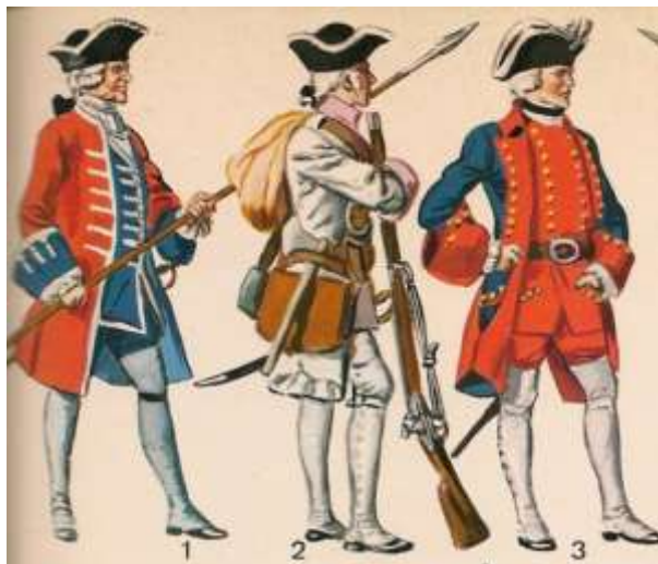
Imagen 9. Peluca de campaña.

Por otro lado, este tipo de pelucas eran incómodas para llevar a cabo cualquier tipo de actividad por lo cual los soldados decidieron cambiarla por otra conocida como peluca de “campaña”. Esta consistía en una masa de rizos la cual estaba dividida en 3 mechones, uno a cada lado de la cara y otro detrás, cuyos extremos doblaban hacia arriba y eran atados con un lazo.