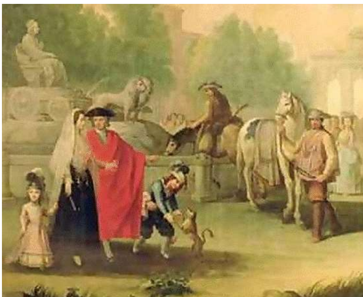
Imagen 15. Majistas.

Durante el siglo XVIII, se les conocía a las personas de estratos bajos como Majos y los cuales estaban situados en los barrios bajos de Madrid. En estas zonas “los hombres llevaban una redecilla para recoger el cabello. Peinaban frondosas patillas. En vez de corbata, se anudaban un pañuelo de colores en el cuello, sin tapar el cuello de la camisa el cual siempre iba visible. Vestían una casaca corta, ornamentada en las bocamangas y sisas, chaleco y calzón, así como una faja de vivo color” 3 .