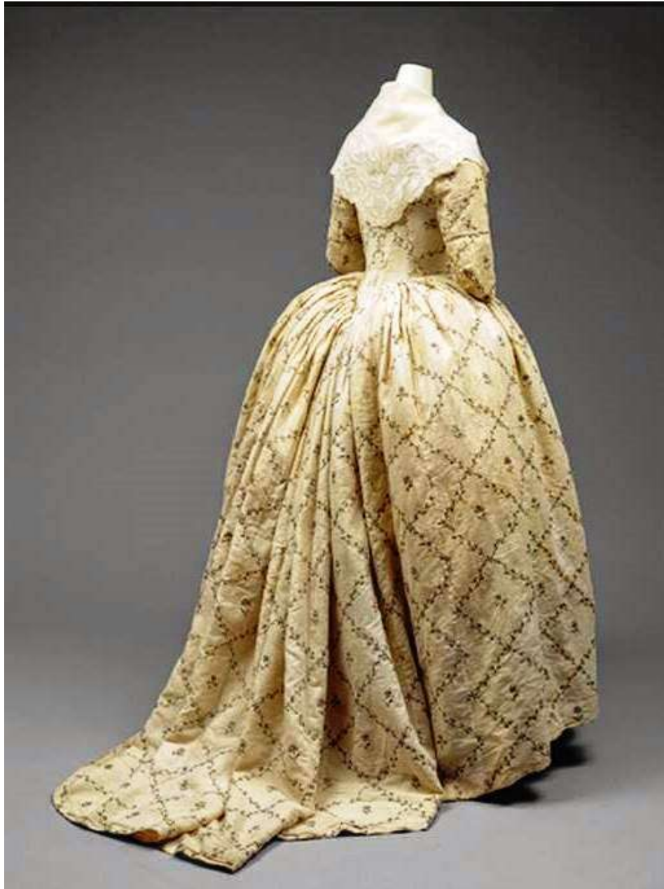
Imagen 24. Vestido a la inglesa.

Consistía en una bata que incorporaba ballenas por lo cual dejó de usarse la cotilla y el peto. “Es muy característico el aguijón que el jubón de esta bata dibuja sobre la parte posterior de la cintura. El amplio escote gustaba “adecentarlo” con un sutil pañuelo de muselina. La bata a la inglesa es perfectamente compatible con el drapeado de la falda a la polaca” 4 .