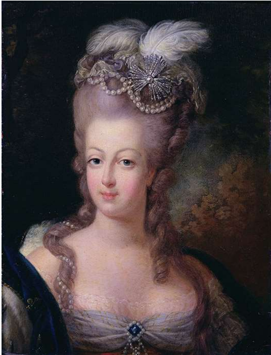
Imagen 29. Horquillas dobles.

El tocado en algunas ocasiones se decoraba con objetos inimaginables como un barco con las velas desplegadas, un molino de viento con animales de granja alrededor hasta incluso un jardín con flores naturales o artificiales. De igual manera, podía cubrirse también con un sombrero.