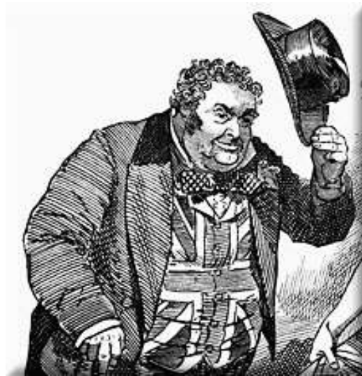
Imagen 2. John Bull.