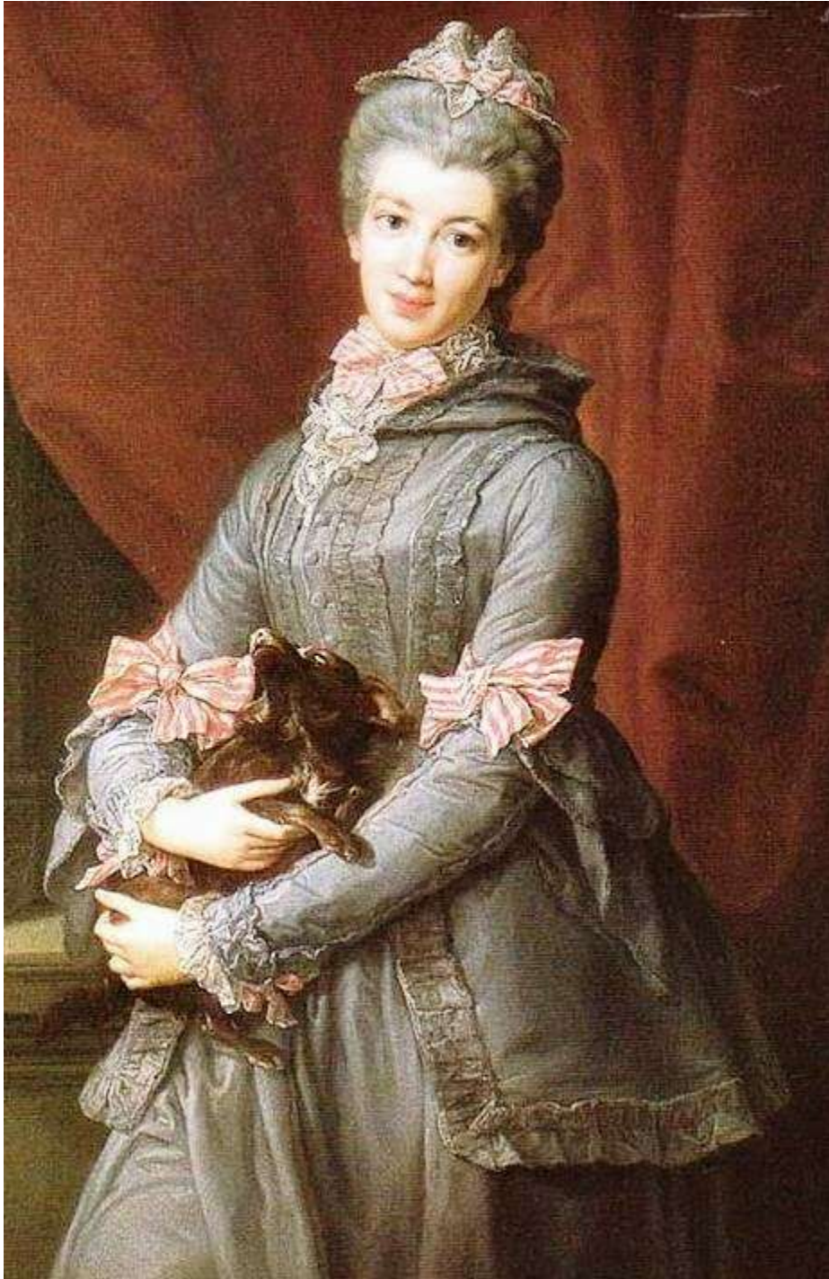
Imagen 23. Vestido a la Brunswick.

Es similar al vestido polonesa, solo que este disponía de una casaca con capucha.