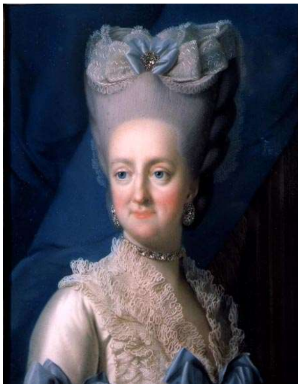
Imagen 31. Sombreros.

En cuanto a los sombreros, a comienzos de los 70 eran pequeños, pero a medida que pasaba el siglo, empezaron a ser cada vez más grandes. Algunos eran hechos en un material suave, otro tenían la copa dura y las alas anchas adornadas con plumas.