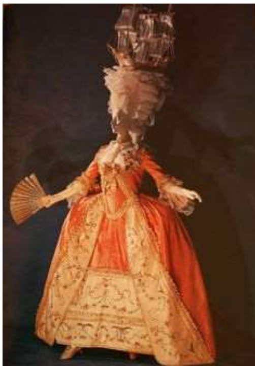
Imagen 30. Complementos del tupé.

En cuanto a los sombreros, a comienzos de los 70 eran pequeños, pero a medida que pasaba el siglo, empezaron a ser cada vez más grandes. Algunos eran hechos en un material suave, otro tenían la copa dura y las alas anchas adornadas con plumas.