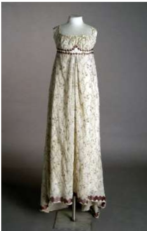
Imagen 1. Vestido imperio.

A finales de siglo las líneas generales de la indumentaria estaban ya establecidas donde las mujeres empleaban el traje imperio y los hombres, una indumentaria en la que se reconoce ya a John Bull (personificación nacional del reino Unido y, en particular, de Inglaterra, especialmente en el humor gráfico político).