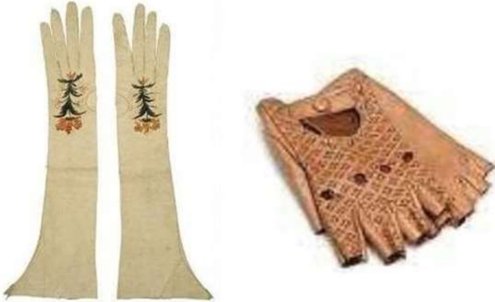
Imagen 34. Guantes y mitones.

Durante este siglo, las mujeres usaban dos tipos de guantes, los primeros eran mitones cortos de seda los cuales “eran enriquecidos con hilo en la decoración de los costados. La boca del mitón se remataba con una decoración de punto calado” 6 . Los otros eran guantes largos los cuales llegaban hasta el antebrazo. “Están hechos con piel de cobritilla (Piel curtida de cabrito o cordero joven, muy fina, suave y flexible) y decorados con hilo de seda y algunos con motivos florales” 7 .