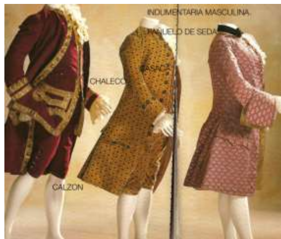
Imagen 3. Traje masculino.

Los calzones hasta la rodilla fueron los más comunes durante todo el siglo. Iban un poco sueltos y se ajustaban encima de las caderas sin necesidad de un cinturón o tirantes, estos se cerraban por encima de la rodilla con 3 o 4 botones, y al principio el borde de las medias se colocaba encima de ellos. A partir de 1735, aproximadamente, se cerraban con una hebilla decorada y se llevaban por encima de las medias.