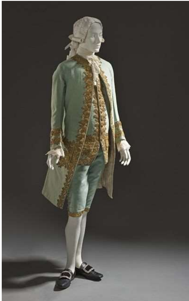
Imagen 6. Traje español 1760.

Para completar estos trajes, usaban zapatos muy finos con unos enormes bucles de oro, plata, similar o acero, adornados con piedras preciosas auténticas o falsas y ostentaban grandes botones en los abrigos. Usaban sombreros pequeños hasta la exageración, pero sus pelucas, prodigiosamente rizadas, sobresalían por encima de la cabeza.