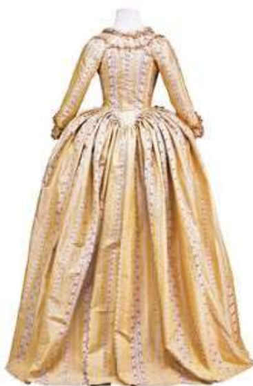
Imagen 18. Vestido cerrado.

Surgió una clasificación de los vestidos femeninos donde los dividieron en “vestidos cerrados” los cuales consistían en un cuerpo y unas enaguas (a veces formando un traje completo) sin ninguna abertura en el delantero de la falda.