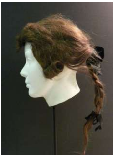
Imagen 10. Peluca Ramillies.

Otro tipo de peluca era la peluca “Ramillies” llamada así después de la victoria de Marlborough sobre los franceses en 1706, en esta, el cabello se echaba hacia atrás y se ataba en una coleta larga, generalmente con dos lazos negros, uno en la parte superior y otro, más pequeño en el extremo inferior.