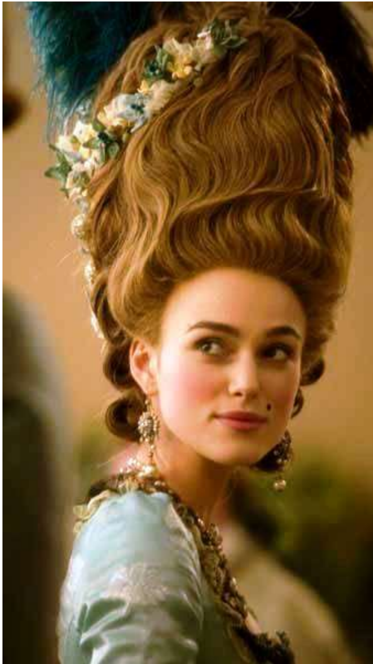
Imagen 28. Tupé.

A mediados de los años 70 se empezó a emplear un tocado conocido como tupé el cual era en forma de torre puesto todo hacia arriba desde las raíces, estirado sobre un cojín y colocado en la parte superior de la cabeza formando así la parte central del artificio, posteriormente, se colocaban a los lados hileras de rizos, un rodete colgante por detrás lo que ayudaba a que se mantuviera firme y a salvo del agua mediante largas horquillas negras, simples y dobles.